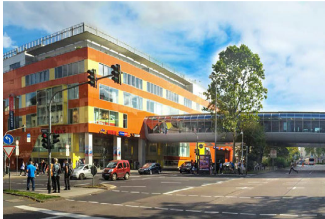
2016 - Einkaufserlebnis im Herzen von Wiesbaden – 50 Fachgeschäfte, 800 Parkplätze