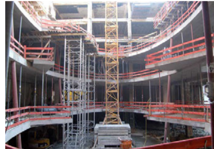
2007 – Von Grund auf NEU